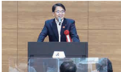
来賓あいさつ(大村知事)